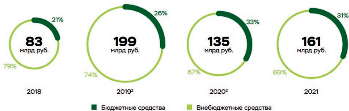
Рис. 2. Динамика объемов финансирования региональных программ в области энергосбережения и повышения энергетической эффективности в России за период 2018–2021 годов [3]

законодательные акты Российской Федерации» (далее – закон № 261-ФЗ). Согласно данному закону, энергетическая эффективность представляет собой характеристики, отражающие отношение полезного эффекта от использования энергетических ресурсов к затратам энергетических ресурсов, произведенным в целях получения такого эффекта.