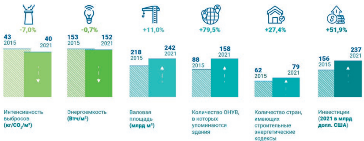
Рис. 1. Основные тенденции в области строительства зданий и сооружений в мире в 2015 и 2021 году [2]

Базовым нормативным правовым актом, регламентирующим аспекты энергоэффективности зданий, строений, сооружений, является Федеральный закон от 23 ноября 2009 года № 261-ФЗ «Об энергосбережении и о повышении энергетической эффективности и о внесении изменений в отдельные